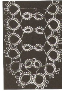
14. Einfäße zum Durchziehen.