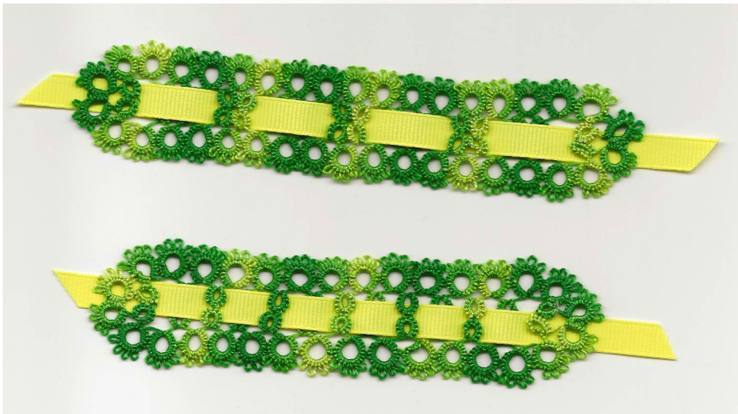
Models by Stephanie Wilson; top and middle are fig. 14.